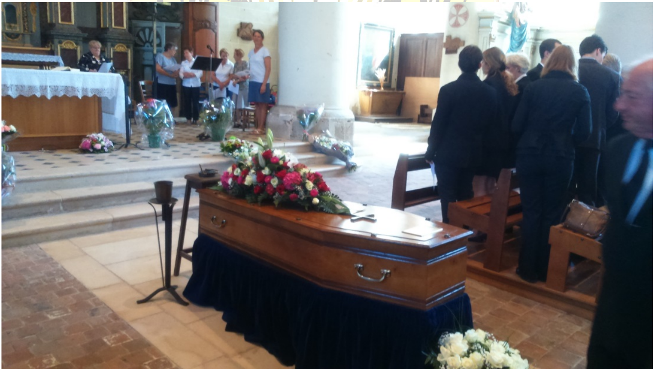
l'église Saint Pierre - Saint Paul de Courtenay dans le Loiret le 08 Septembre 2016 .